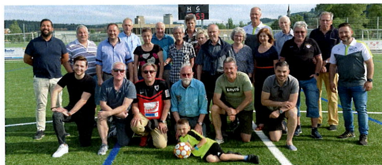
Mitglieder des Hunderter-Clubs und Vorstand des FC Villmergen

Sie sind herzlich willkommen. Der Vorstand Hunderter-Club